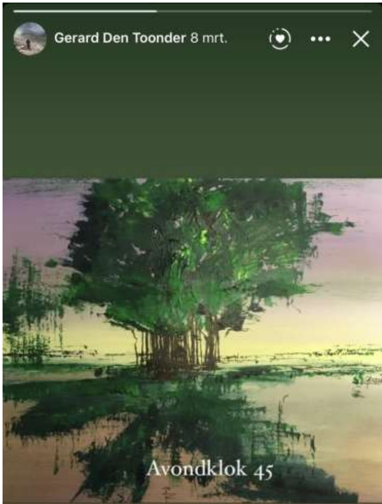
3 maanden avondklok in 2021